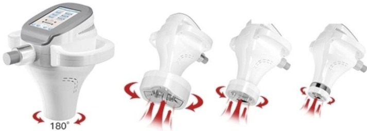
Cavitation tête rotative